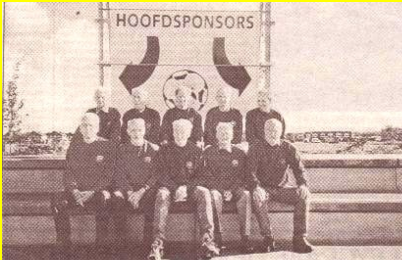
De mannen van de M.O.T., ook wel genoemd het "Super Senioren Team".