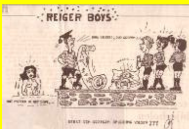
Een spotprent in de Alkmaarsche Courant.