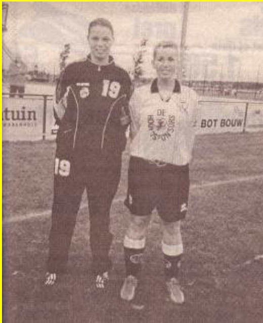
Twee speelsters tonen nieuwe outfit Reiger Boys.