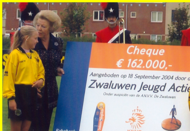
Hare Majesteit op bezoek.