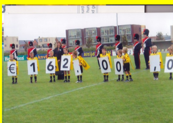
...nou ja...er ontbreekt een "nul"