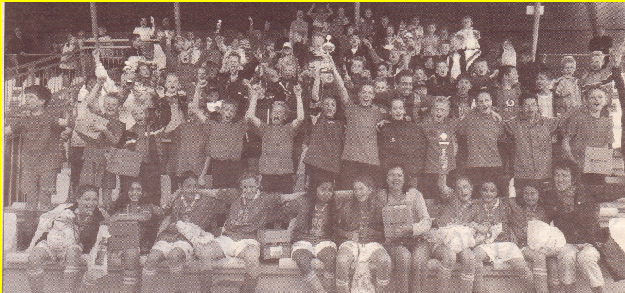
Schoolvoetbal kent spannende ontknoping.