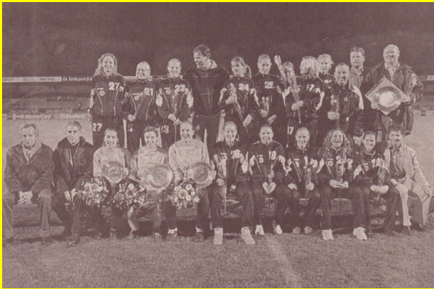
Damesteam wint Fair-play Cup 2002 -2003