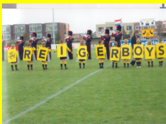
De Zwaluwenactie brengt op.....