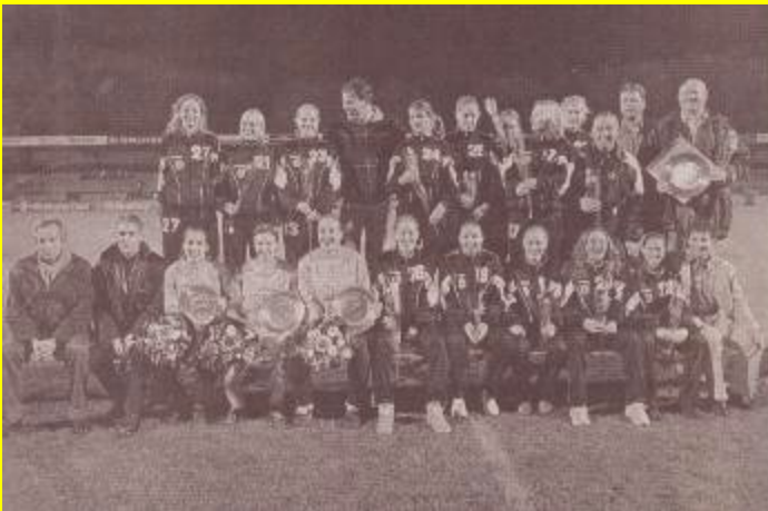
Damesteam wint Fair-play Cup 2002 -2003