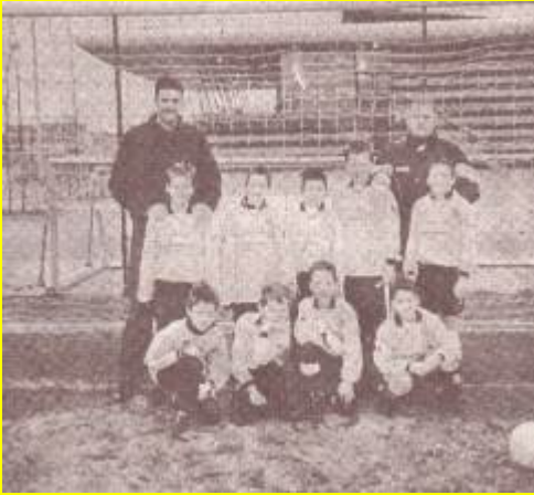
Automontagebedrijf "De Ooyevaar steekt junioren E2 in het nieuw.