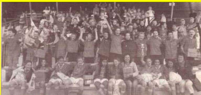
Schoolvoetbal kent spannende ontknoping.