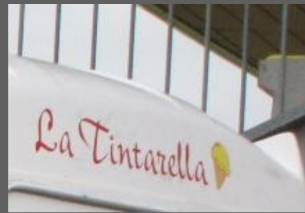
La Tintarella was medesponsor. Het ijs vond gretig aftrek.