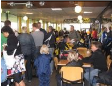
Niet alleen buiten, maar ook binnen was het bij tijd en wijle een drukte van belang.