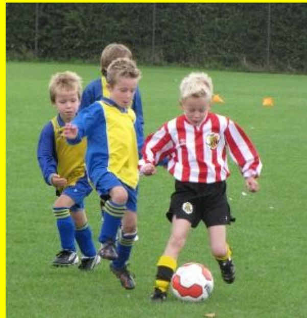
Drie tegen een, niet eerlijk.