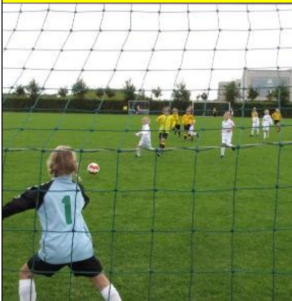
Reiger Boys meisjes in de aanval.