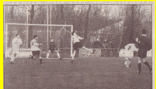
Ondertussen gaan de sportieve activiteiten gewoon door,