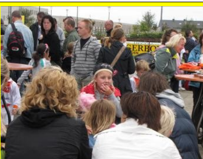
Suikerspin is toch wel echt genieten!