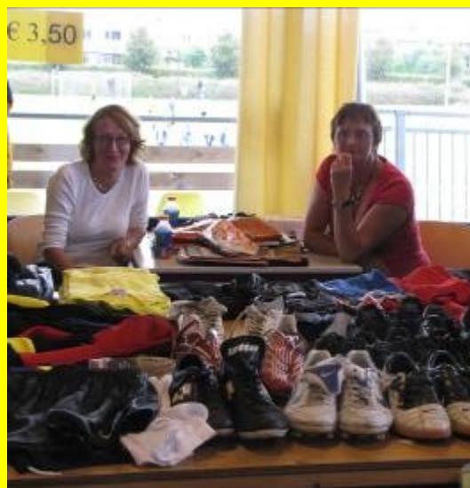
Verkoop tweedehands sportkleding.