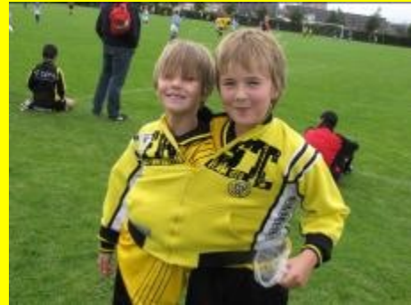
Shirt, maat XXXXXXL