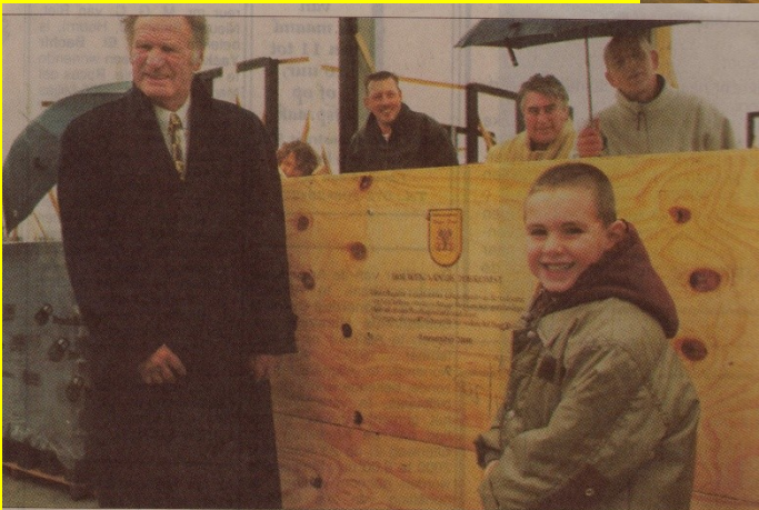
Gedenkplaat markeert de groei