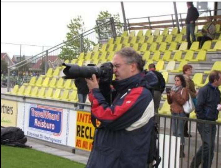
Fotograaf Maarten Post aan het werk.