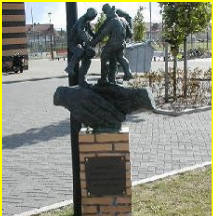
De door de Stichting "Vrienden van Reiger Boys" geschonken beeldengroep ter gelegenheid van het in gebruik genomen sportlandgoed "De Wending". Helaas weggenomen op een vrijdag in september 2009.