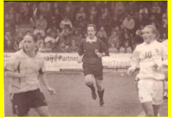
Spelmomenten uit dameswedstrijd Nederland -Zwitserland.. Uitslag 0 - 2.