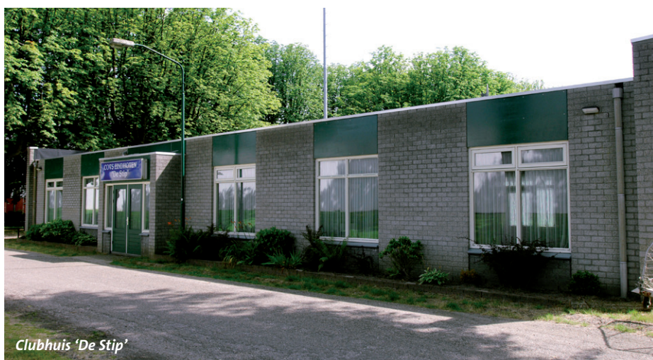
Clubhuis 'De Stip'