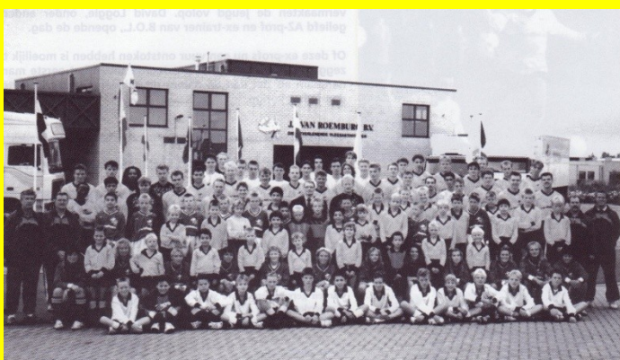
Met sponsor vsn Roemburg op de foto! Het contract met van Roemburg was getekend. Dus met alle gesponsorde teams op de foto (1991 - 1992).