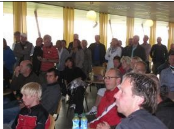
Druk bezette kantine.

dat de trainers van AZ alleen aanwezig waren in die functie. Niet meer, niet minder. Ze spelen uiteraard zelf bij een eigen vereniging, maar clubbelangen spelen in deze dagen niet mee. Dat moest men zich toch goed realiseren. Het gaat om de kinderen. Er volgde applaus en men vetrok naar de velden om de verrichtingen van zoon en of dochter te kunnen volgen.