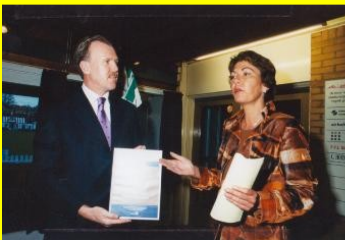
De voorzitter aan het woord.

Bestuur Reiger Boys 3e bij verkiezing tot sportbestuur van het jaar. Staatssecretaris Vliegenthart overhandigt de oorkonde.