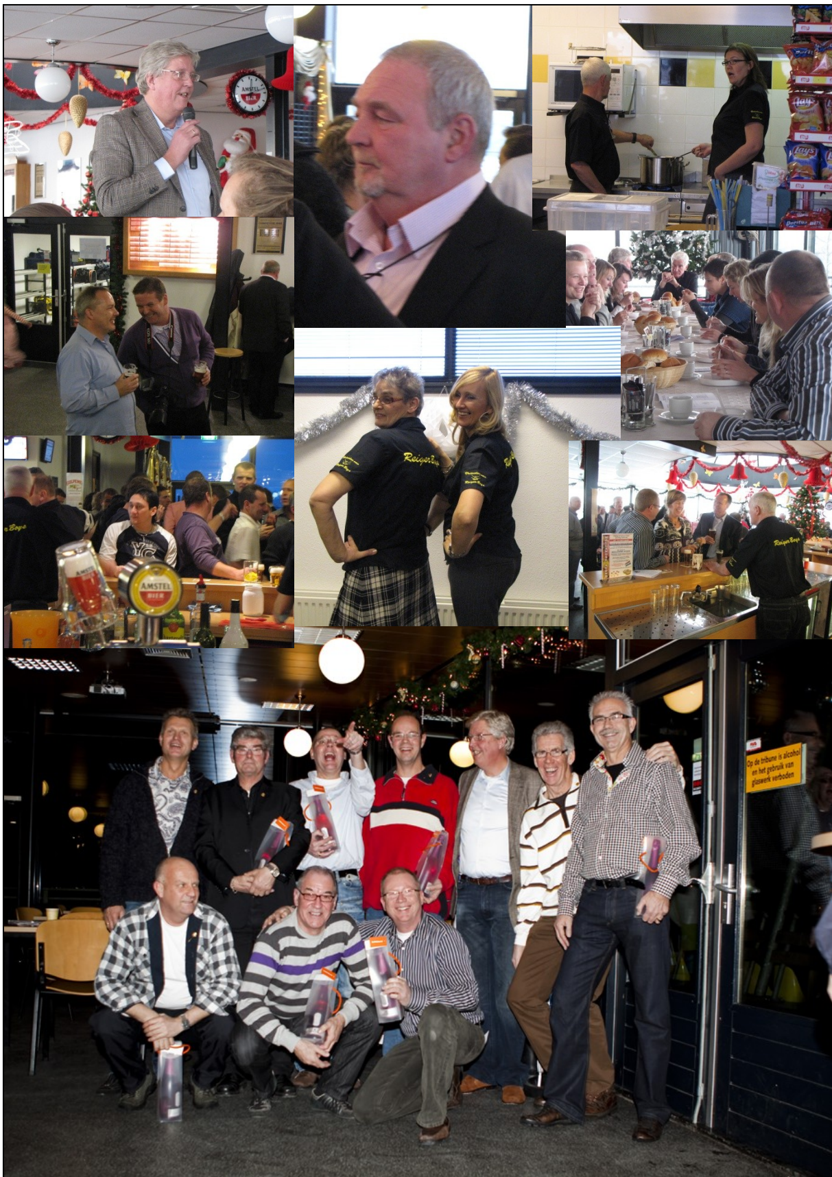
Jubilarissen en leden van verdienste poseren met de voorzitter.